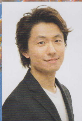
テノール 安富 泰一郎